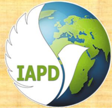
International Alliance for Peace and Development

Maat, in cooperation with more than 20 Arab, African and European organizations, established a non-governmental organization in Geneva in accordance with the provisions of Swiss law. Maat initiated the establishment of the coalition since September 2017 and launched its founding statement in February 2018 until the coalition was formally established as an organization in September 2018, and is concerned with issues of promoting peace, rejecting violence and extremism, and achieving the 2030 Sustainable Development Agenda.